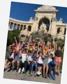
Sortie au musée d'histoire naturelle de Marseille