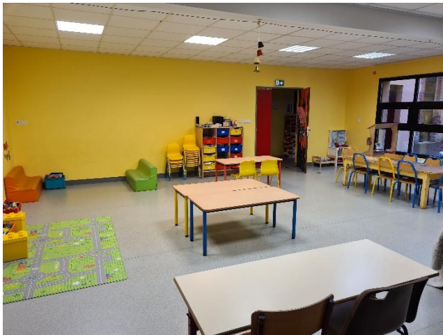
Salle 3-5 ans 1