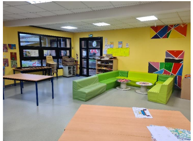
Salle 6-11 ans 1