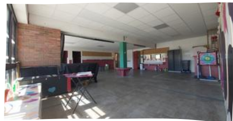
préau couvert +6 ans