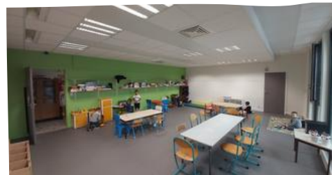
salle d'activités -6 ans