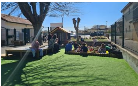
espace calme et bac à sable