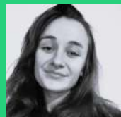
Amélie (Domfront Tinchebray)