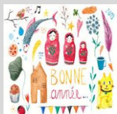
Bonne Année !! Gateau Montecaos