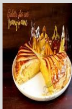
Galette partie A vos couronnes